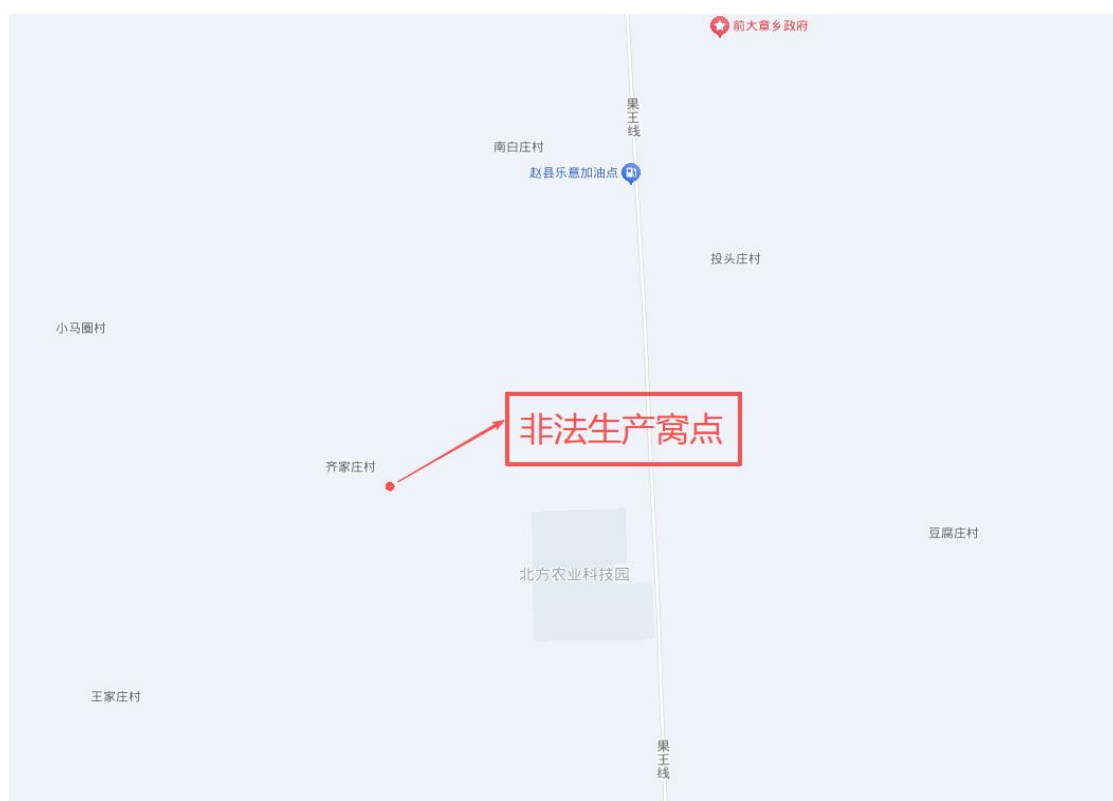
图 1 事故单位地理位置图

厂闲置地块建设了 3 个圆拱顶钢架塑料膜养猪大棚，2018 年 12 月，左某某又建设了 3 个彩钢顶临建镂空棚用于养牛，2019 年 9 月 17 日在赵县审批局注册个体工商户营业执照，名称为赵县左氏兄弟养殖场。2024 年 3 月，左某某自行出资购买铁罐、冷凝器、鼓风机等生产设备安装在养殖场最南侧养猪大棚内。2024 年 5 月起，左某某 [2] 雇佣袁某 [3] 在该场所非法从事生产、储存、销售危险物品 [4] 活动。