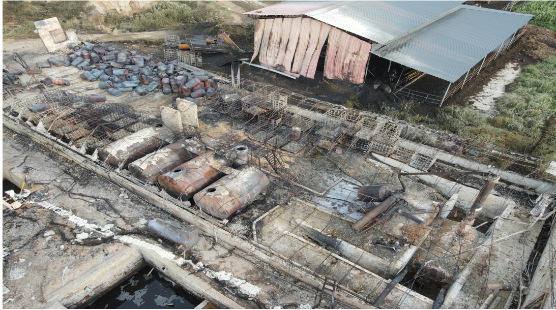
图 3 非法窝点现场设备情况

罐 4 个，棚内东南侧存储有塑料吨桶约 80 个、200L 铁桶约 120 个（见图 3），电动自行车 2 辆，均被引燃烧毁。